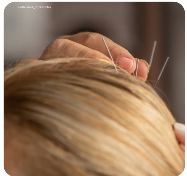
Foto: Akupunktur des Schlafkranzes

Alternativ zu Nadeln sind auch magnetische Ohrkugeln möglich. Es wird in jede Zone jeweils ein Goldkugeln geklebt. Als weitere Möglichkeit kann die Akupunktur des Schlafkranzes vorgenommen werden.